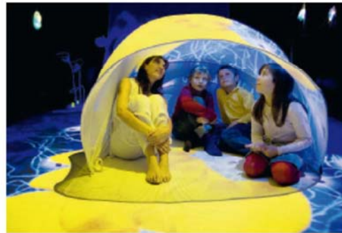
FARFALLE Un'immagine di uno degli spettacoli messi in scena dal Tpo

«L'obiettivo era creare qualcosa di nuovo: era un modo diverso di pensare il teatro, di coinvolgere il pubblico, di eliminare quella barriera tra spettatore e palcoscenico. Il primo spettacolo si chiamava 'Devian-