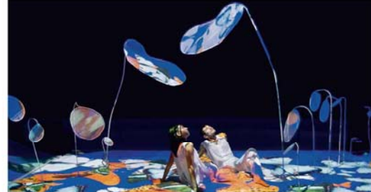
Deux danseurs évoluent, tels papillons, dans un monde virtuel de lumières et de couleurs.